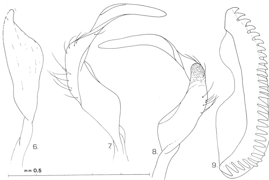
Figg. 6-9: Phytocoris (Eckerleinius) sanctipetri n. sp. — Fig. 6: parametro destro; Figg. 7 e 8: parametro sinistro in due diverse posizioni; Fig. 9: armatura della vescica.

La descrizione viene eseguita su 2 ♂♂ (olotipo e 1 paratipo) raccolti su Quercus suber nel bosco di Santo Pietro (CT: Caltagirone) il 26.V.84; 2 ♂♂ (paratipi) sulla stessa pianta e nella stessa località il 22.V.83; 1 ♀ (allotipo) su Phyllirea angustifolia a Cala Rossa (PA: Terrasini) il 25.III.79; 1 ♂ (paratipo) nella riserva Zingaro (TP: S. Vito Lo Capo) il 24.V.80.